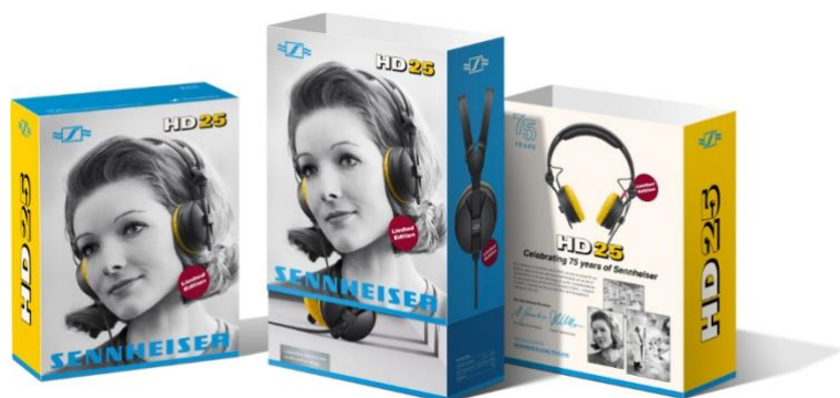
Boîte rétro du HD 25 Limited Edition

Pour les plus chanceux, un modèle HD 25 en édition limitée sera livré après avoir commandé un modèle HD 25 standard. Outre les habituels coussinets noirs, l'édition limitée comprend des coussinets jaunes additionnels, inspirés par les célèbres couleurs d'une toute autre icône : le HD 414 de Sennheiser, le premier casque ouvert au monde. Les écouteurs HD 25 en édition limitée portent également un logo Sennheiser rétro sur les écouteurs et sont livrés dans une boîte avec un élégant fourreau rétro.